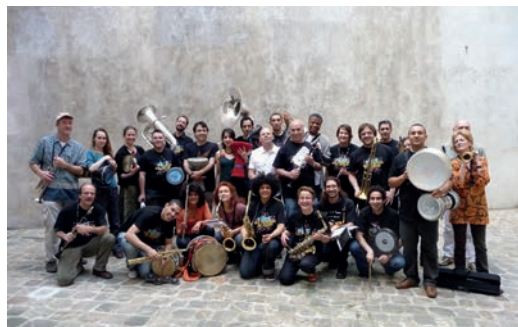
93 Super Raï Band