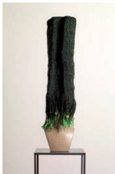
Meschac Gaba, Tour Montparnasse , 2006 © Marc Domage, ADAGP, Paris 2015.