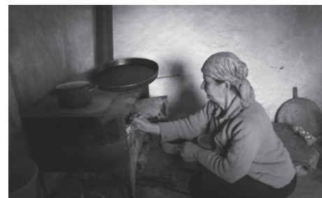
Croate de Letnika, Kosovo

Si ces immigrés sont confrontés à des problèmes d'intégration, les discriminations qu'ils subissent ne sont pas différentes de celles que rencontrent les bulgares issus des minorités.