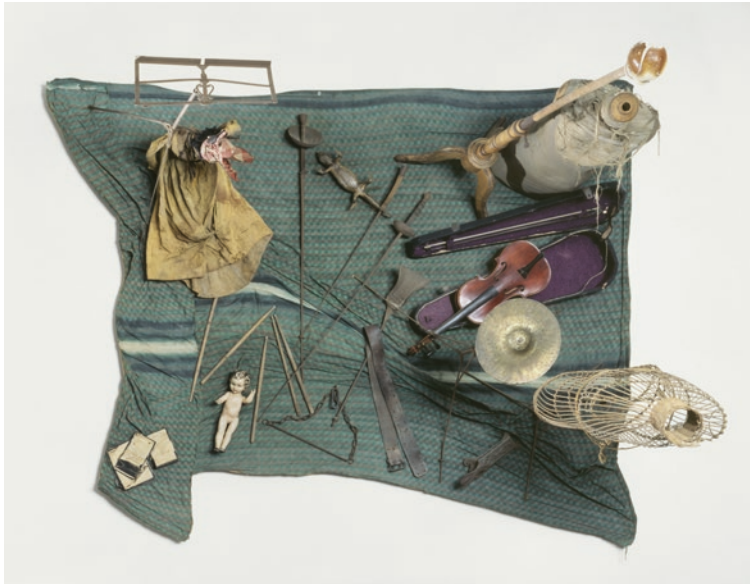
Daniel Spoerri, Marché aux puces (hommage à Giacometti), 1961. Centre Pompidou, Paris. Musée national d'art moderne/ Centre de création industrielle. © Adagp, Paris, 2022.