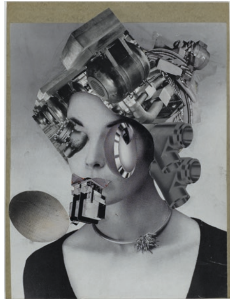
Erró, Madame Picabia , Série Collage Paris , vers 1959. Photo © Centre Pompidou, MNAM-CCI, Dist. RMN-Grand Palais/ Philippe Migeat. © Adagp, Paris, 2022.