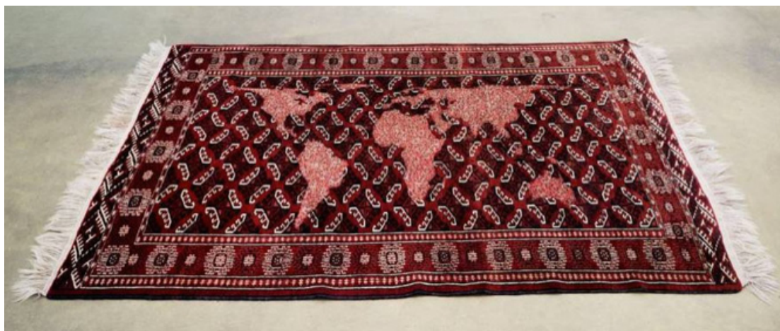
Mona Hatoum, Bukhara (red and white) 2008 / Tapis en laine (143 x 225 cm) - Collection Musée national de l'histoire de l'immigration - photo : Martin Argyroglo, Courtesy Galerie Chantal Crousel, Paris © ADAGP Paris 2016