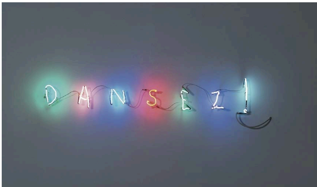
Claude Lévêque, Sans titre (Dansez!), 1995.

« Les collectionneurs ont ceci de particulier qu'ils peuvent le plus librement du monde s'abandonner à leur passion. A travers les œuvres qu'ils accumulent, ils expriment leur rapport au monde et qui ils sont. Agnès b. collectionne depuis toujours avec cette position particulière d'être elle-même une figure majeure de la scène artistique française.