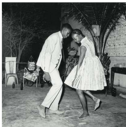
Malik Sidibé, Nuit de Noël , 1965

Du 18 octobre 2016 au 8 janvier 2017, la collection agnès b. investit le Musée national de l'histoire de l'immigration pour un dialogue inédit avec les œuvres contemporaines du musée. C'est la première fois qu'agnès b. choisit de montrer à Paris une sélection d'œuvres — photographies, installations, peintures, vidéos — issue de l'extraordinaire collection d'art contemporain qu'elle a constituée au fil des années.