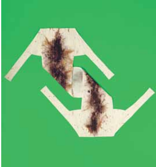
Issey Miyake, combinaison réalisée à partir des tenues du créateur enflammées par l'artiste Cai Guo Qiang le 5 octobre 1998, dans le cadre de la performance « Dragon Explosion » à la Fondation Cartier, Paris, 1998