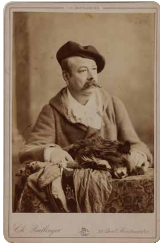
Charles Reutlinger (1816-1880) Portrait de Charles Frederick Worth, 1885. Palais Galliera, musée de la Mode de la Ville de Paris

L'histoire dit que Charles Frederik Worth aurait souhaité que son nom se prononce à la française : « Vort ».