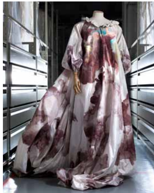
Vivienne Westwood, Robe Fragonard, 1991, soie imprimée, rehauts de peinture acrylique. Collection Palais Galliera, musée de la Mode de la Ville de Paris