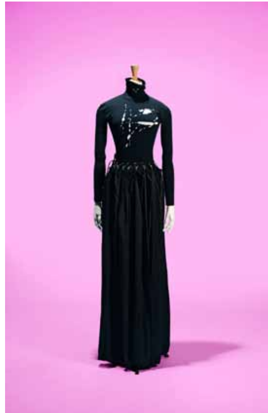
Martin Margiela, ensemble body troué et jupe rideau, Automne - Hiver 1990. Collection Palais Galliera, musée de la Mode de la Ville de Paris

De l'Académie des beaux-arts d'Anvers, sept créateurs ont émergé au début des années 1980. Ils ont influencé la mode des années 1980, 1990 et 2000, imposant un univers conceptuel, poétique et réel. Martin Margiela, qui fut l'assistant de Jean Paul Gaultier en 1984, fait figure de proue. Il inaugure sa