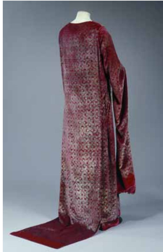
Mariano Fortuny, Tea-gown, vers 1912, velours de soie imprimé d'or, perles en verre de Murano - Palais Galliera, musée de la Mode de la Ville de Paris, don de la Société de l'Histoire du Costume

Venue de l'Est, Sonia Delaunay et les territoires de création qu'elle a ouverts sont à considérer au même titre. La Révolution russe de 1917 chasse la noblesse qui s'installe à Paris : le prince Félix et son épouse Irina Youssouppoff fondent la maison Irfé en 1924 alors que Natalia Gontcharova pour Myrbor et plus collectivement les ateliers Kitmir imposent l'art du fil décoratif. Plus récemment, le Japonais Issey Miyake, par des découvertes techniques liées au plissé dont il raffine l'usage et qu'il rend plus léger, a considérablement œuvré à un renouvellement vestimentaire. Dries Van Noten, de son côté, s'est différencié de ses contemporains belges par un goût des couleurs et des motifs devenus signature.