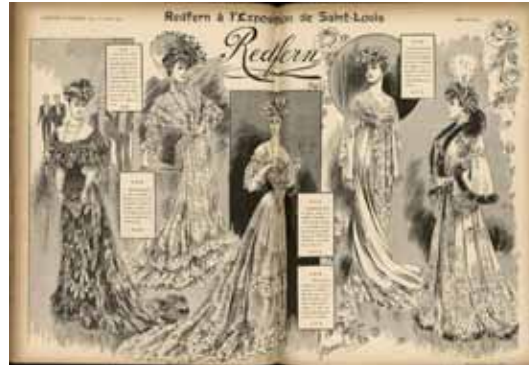
« Redfern à l'Exposition internationale de Saint-Louis » L'Art et la Mode, n°23, 3 juin 1904. Musée des Arts décoratifs, Paris

Le style Worth exubérant, flamboyant, est à lire parfois dans les collections de Vivienne Westwood, de John Galiano ou d'Alexander McQueen pour ne citer qu'eux. Leurs fastes et leurs goûts de la provocation sont aussi des hommages au couturier fondateur.