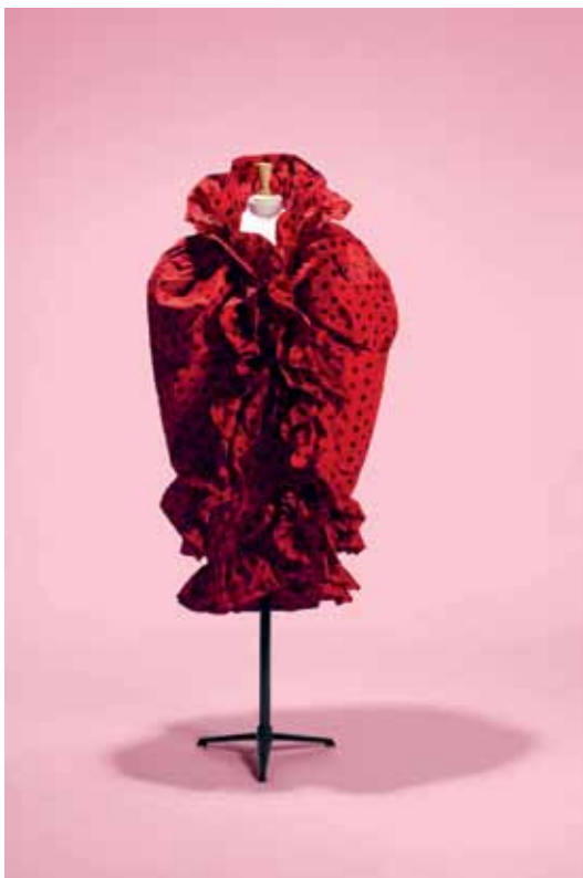
Cristóbal Balenciaga, ensemble robe et cape, haute couture Printemps - Été 1962. Faille de soie imprimée Collection Palais Galliera, musée de la Mode de la Ville de Paris

Quelques mois plus tard, c'est entre les murs de l'Élysées hôtel qu'est imaginée sa première collection pour l'hiver 1937. Le succès est immédiat. En 1958, la France le nomme chevalier de la Légion d'honneur pour sa contribution à la prééminence de la couture et de la mode parisiennes. Christian Dior, quant à lui, l'identifie comme « notre Maître à tous ».