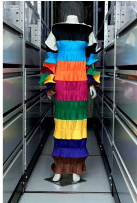
Issey Miyake Robe Longue, Printemps - Été 1994

Depuis leur arrivée à Paris, il y a désormais une quarantaine d'années, ces créateurs japonais ne se sont pas laissés divertir par les modes au souffle court.