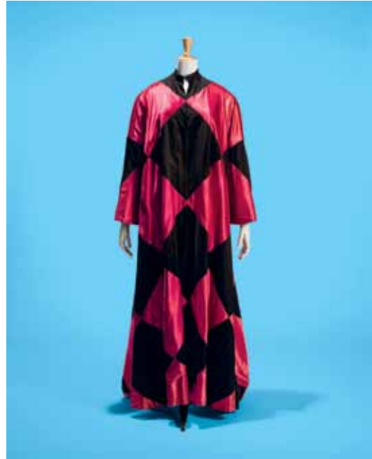
Elsa Schiaparelli, manteau du soir ayant appartenu à Elsa Schiaparelli, haute couture Automne – Hiver 1949, collection Palais Galliera, musée de la Mode de la Ville de Paris