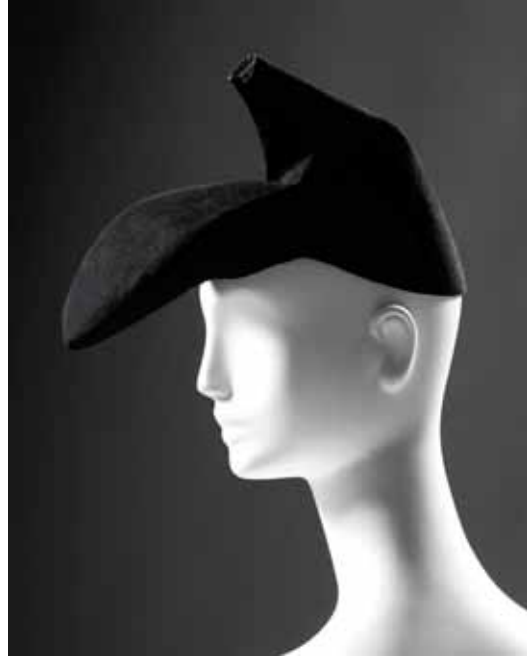
Elsa Schiaparelli, chapeau-chaussure, Hiver 1937-1938 Feutre noir Collection Palais Galliera, musée de la Mode de la Ville de Paris