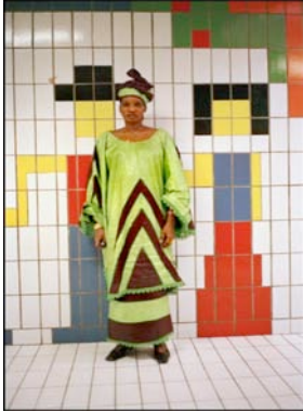
Fama. Evry, Ile-de-France, 2003