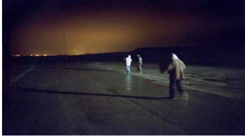
Sangatte, Pas-de-Calais, 2001