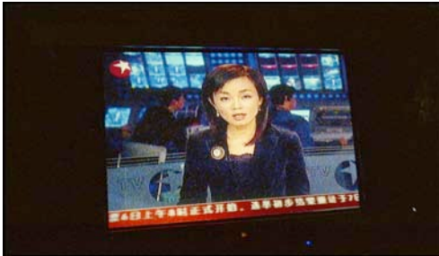
Journal télévisé de la CCTV chinoise sur les émeutes en France. Shanghai, Chine, 2005