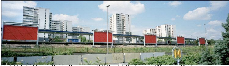
Creteil, Val-de-Marne, Ile-de-France, 1998