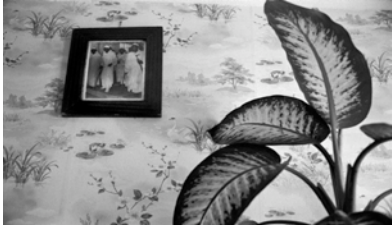
Détail de l'intérieur de la famille Sam, d'origine sénégalaise Résidence "les Sablons", Sarcelles, Val-d'Oise, 1989

1- A quelle date ces photographies ont-elles été prises ?