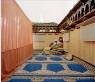
Mosquée du cimetière Bobigny Association des Français musulmans du cimetière de Bobigny, Bobigny, 2003

1- A quelle religion se rapportent les lieux de prière ici photographiés ?