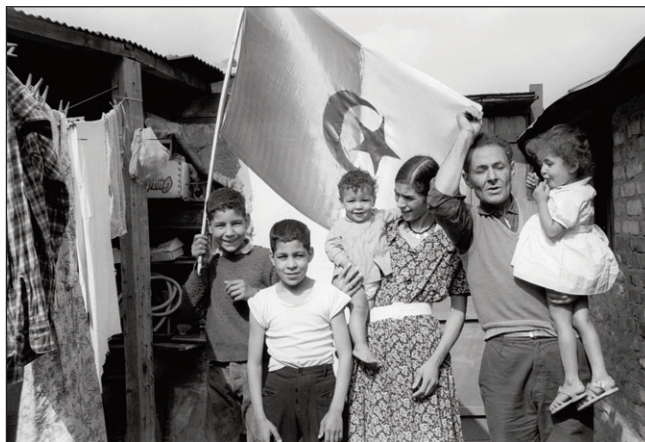
Le jour de l'indépendance dans le bidonville de La Folie à Nanterre.