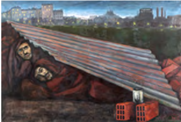
André Fougeron (1913-1998), Nord-Africains aux portes de la ville, 1953 (huile sur toile)

-Observez le tableau d'André Fougeron Nord-Africains aux portes de la ville reproduit ci-contre, puis répondez aux questions suivantes :