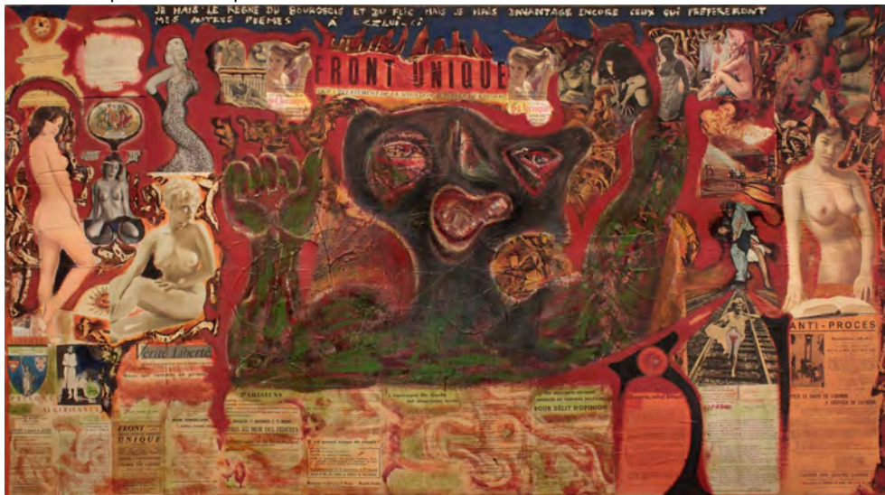
Jean-Jacques Lebel, Front unique , 1962, collection Letailieu © Jean-Jacques Lebel / ADAGP, Paris, 2012