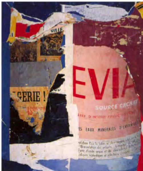
Jacques Villeglé, Carrefour-Algérie-Évian , 1961 ©Jacques Villeglé, collection privée