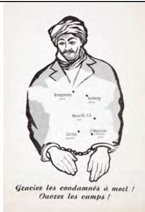
Carte postale éditée par le comité national du Secours populaire français, envoyée au président de la République française

- Placez-vous devant le document reproduit ci-contre puis répondez aux questions suivantes :