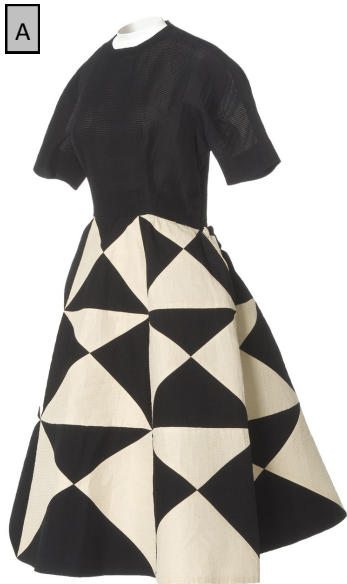
C. Balenciaga, 1952-53

Compétences attendues : Mettre en œuvre une méthode comparative / Repérer et nommer les critères de distinction / Produire une traduction graphique explicite