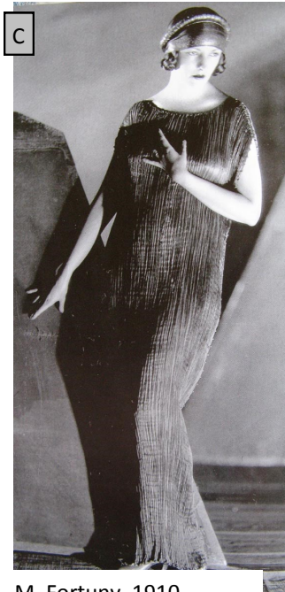
M. Fortuny, 1910