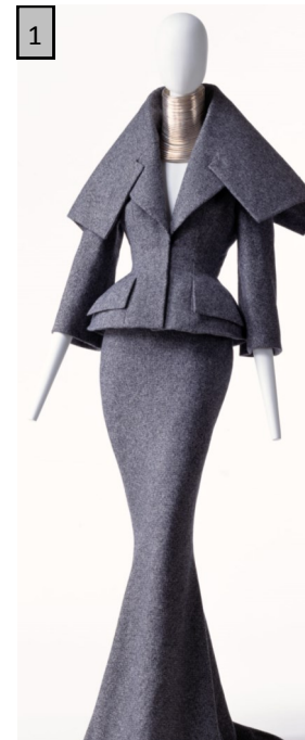
J. Galliano pour Dior, 1997