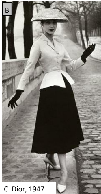
C. Dior, 1947