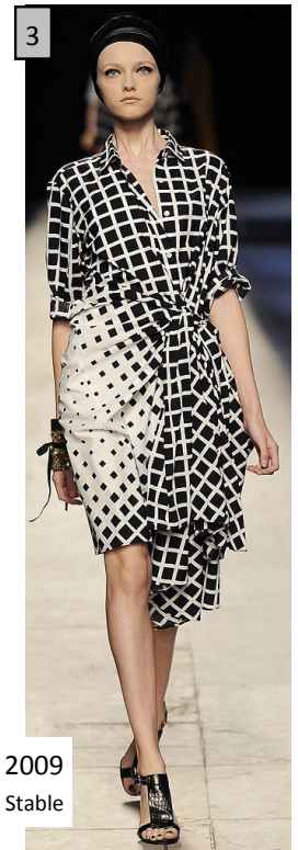
Dries Van Noten, 2009 ©Patrice Stable