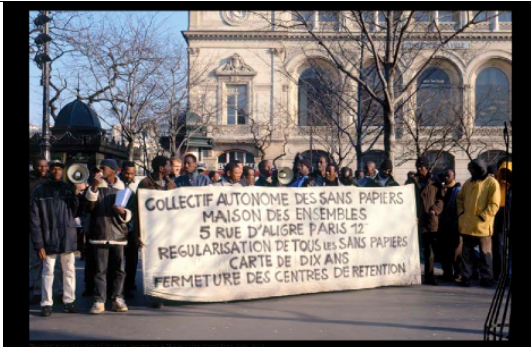
Manifestation du collectif de sans-papiers de la Maison des Ensembles, 2001-2002

a. Quel est le nom du photographe qui a pris cette photo ?