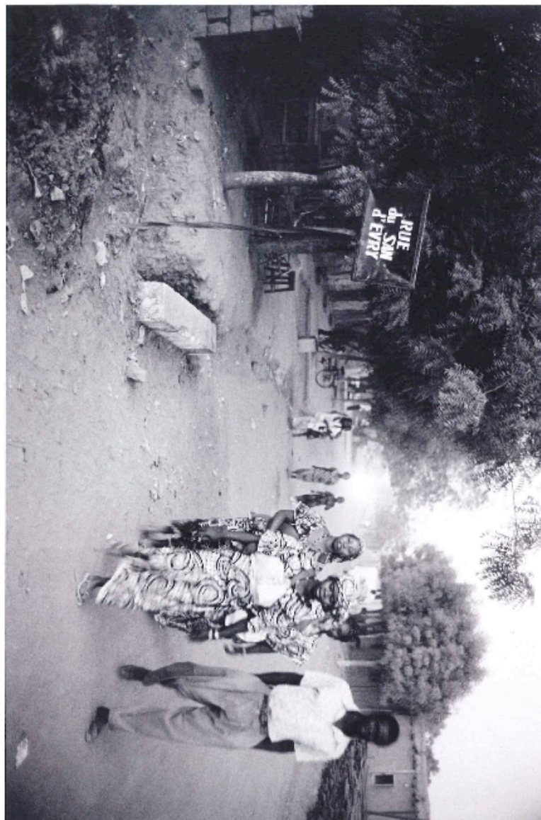
LA RUE PORTANT LE NOM DU COMITÉ DE JUMELAGE ENTRE LES VILLES D'EVRY ET DE KAYES. ZSLC-9553000001197186-11062004