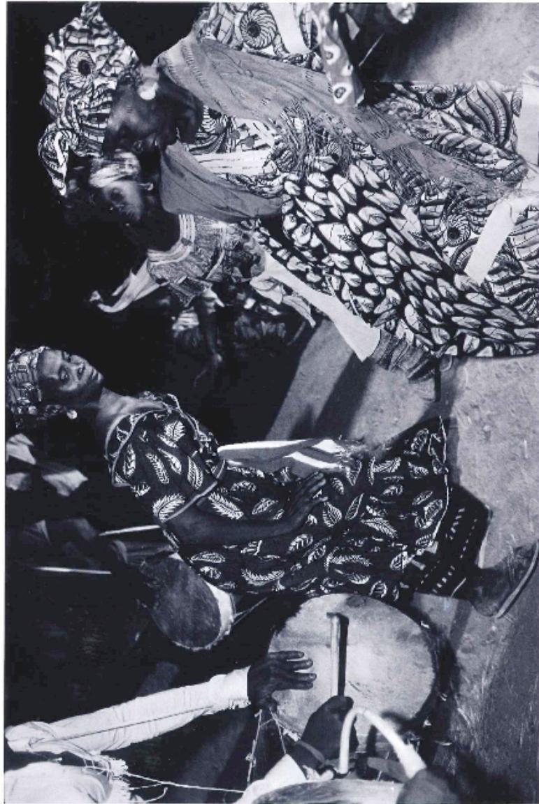
DANSE TRADITIONNELLE POUR CÉLÉBRER LE RETOUR DES TRAVAILLEURS IMMIGRÉS EN FRANCE, DE RETOUR POUR QUELQUES MOIS, NOIR-ET-BLANC, 1993, p.253