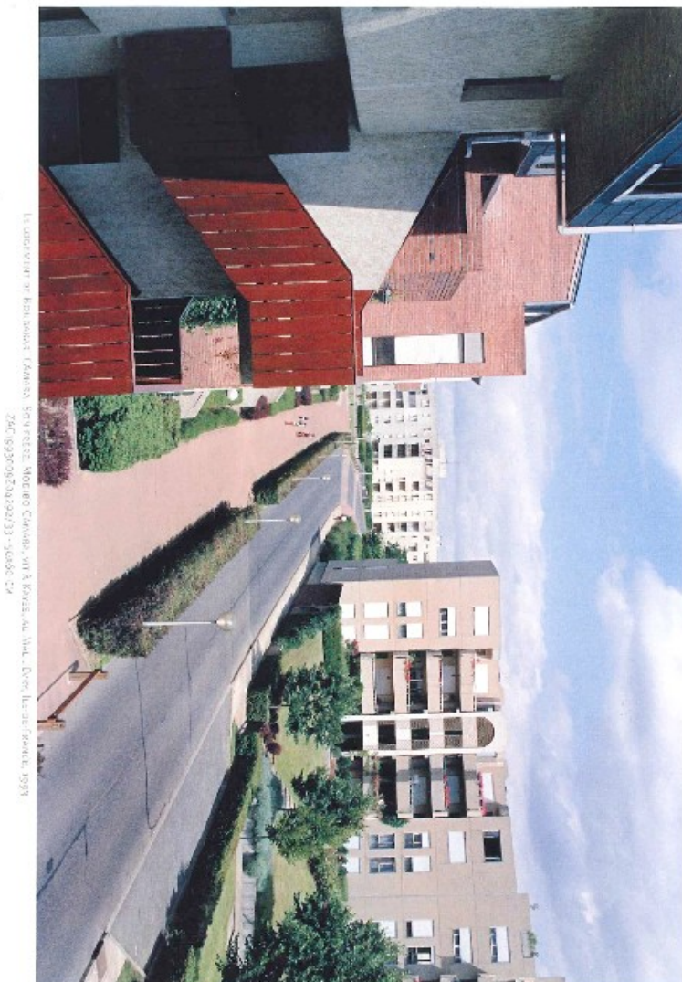
LE QUARTIER DE BOULVAARD LAFAYETTE, ÉVRY FRANCE.