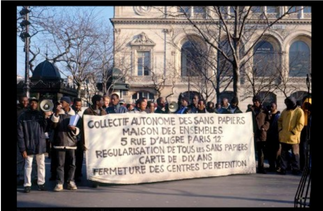
Manifestation du collectif de sans-papiers de la Maison des Ensembles, 2001-2002.

a. Quel est le nom du photographe qui a pris cette photo ?