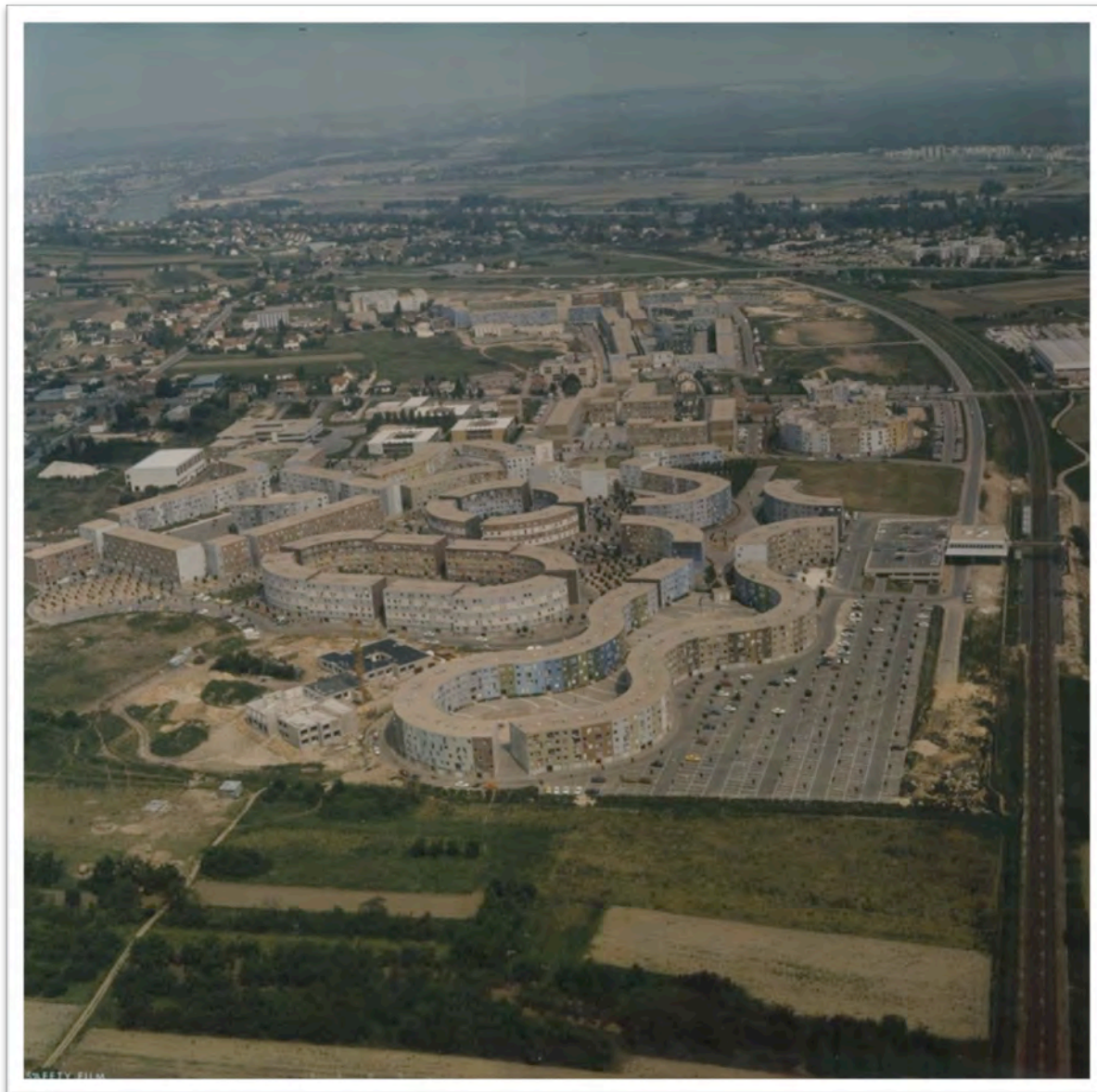
La ZAC 2 de La Noé, implantée sur le site du village de Chanteloup-les-Vignes (Yvelines) et achevée en 1973