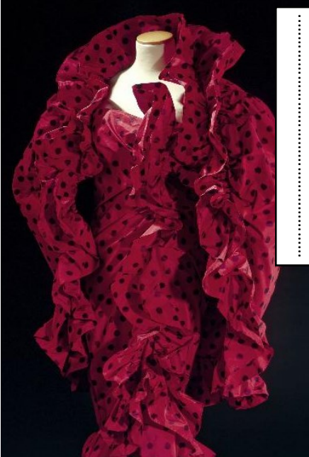
Balenciaga, Cape et robe fourreau, 1962

Une autre histoire de l'immigration ou l'apport fondamental des créateurs étrangers à la Haute Couture et au prêt-à-porter français