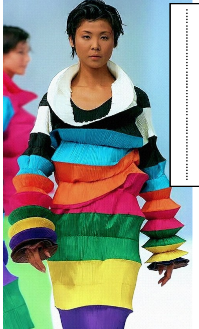
I. Miyake, Pleats please , 1994