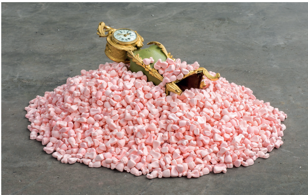
Benjamin Loyauté - To Whom it May Concern © benjamin loyauté studio

Intégré pour la première fois au parcours officiel de Nuit Blanche 2018, le Palais de la Porte Dorée présente une installation inédite en France, L'expérience de l'ordinaire , un nouveau chapitre de l'œuvre évolutive de Benjamin Loyauté, commande de Rubis Mécénat cultural fund.