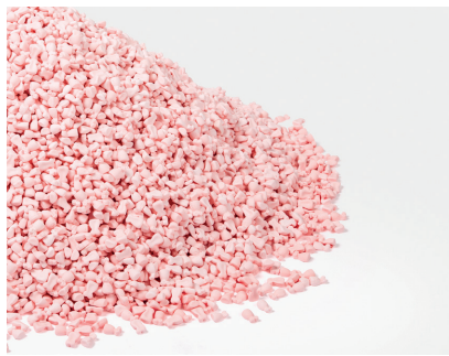
Benjamin Loyauté - Candy Heap , detail, 2015 © Benjamin Loyauté Studio, photo : Sven Laurent