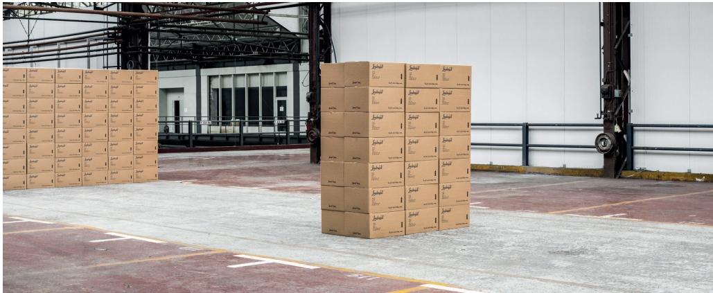
Benjamin Loyauté - The Candygraphy Factory , 2016 Part of the Installation view - KANAL - Centre Pompidou