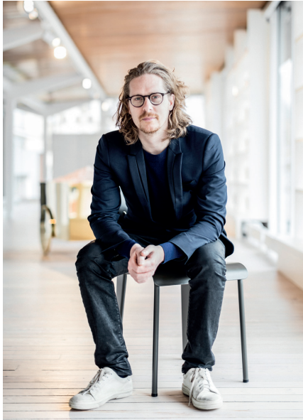
Benjamin Loyauté - Portrait

Benjamin Loyauté (né en 1979 en Normandie, France) vit et travaille entre Bruxelles, Beyrouth et New York. L'artiste développe une pratique qui mêle films, sculptures, interventions publiques et installations immersives. Il puise ses inspirations dans la littérature, le cinéma, l'archéologie, l'histoire des techniques, la géographie et la géopolitique.