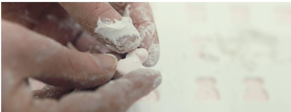
Benjamin Loyauté - Le bruit des bonbons , 2016, HD film, 1,85:1, color, surround sound, 17 min. 54 sec.

Cette exposition mêle différents media - film, installation, sculpture et performance. Elle s'envisage dans son ensemble comme un espace autre, un contre-espace ouvert et méditatif où les conventions et les émotions se libèrent pour accéder à « la magie de l'ordinaire ». Benjamin Loyauté se nourrit des gestes et des habitudes de chacun en changeant régulièrement les paramètres du cadre muséal et le contexte de diffusion de ses sculptures consommables.