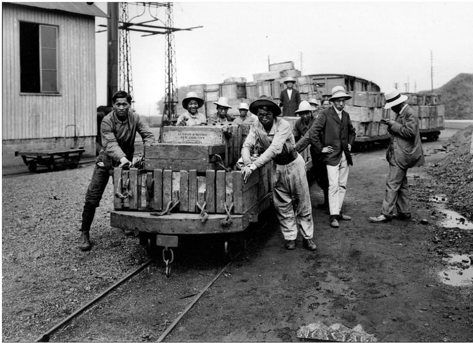
Guerre 1914-1918. Ouvriers chinois transportant des caisses de munition venues des États-Unis dans une gare française.