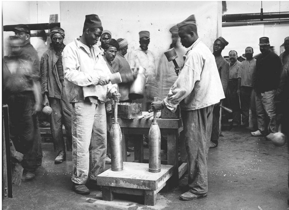
Guerre 1914-1918. "Les travailleurs coloniaux et étrangers dans nos manufactures de guerre", région de Lyon, mi- septembre 1916. Sénégalais chargeant les obus. Photographie parue dans le journal Excelsior du dimanche 17 septembre 1916.