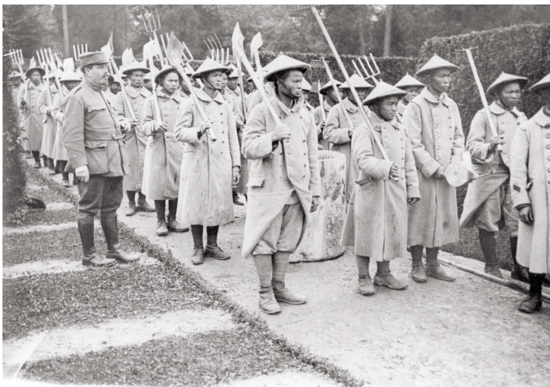
Ouvriers tonkinois encadrés par des soldats français le 26 mai 1917