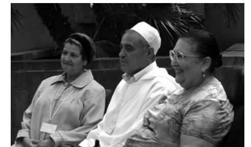
"Dans la vie"